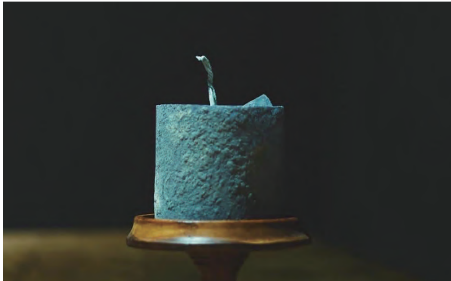
藍と木灰色の蠟燭。「自分の作品をかっこよく、気分良く飾りたい」そんな思いが込められた新店舗「すす」では展示方法にも注目したい。