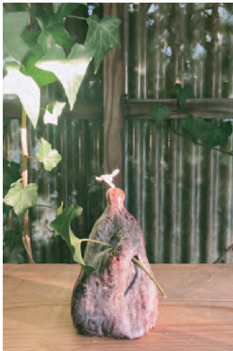
今年から作り始めた手でこねる作品。まるで命が宿っているかのよう。