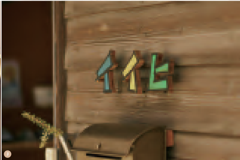
① みんなが集えるワークショップスペース。勉強会など開催。② 台湾茶（蘭の花）Hot:550円（税込）。台湾茶器やドライフルーツと一緒に楽しめる。③ 入り口の様子。入る前から気分が良くなる店のロゴ看板。